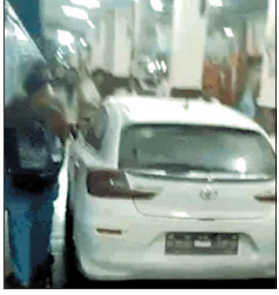
रेलवे कोर्ट ने उस पर चालानी कार्रवाई करने के बाद उसे जमानत

ग्वालियर, 10 जुलाई. ग्वालियर रेलवे स्टेशन पर उस वक्त अफरा-तफरी मच गई, जब एक नशे में धुत युवक अपनी कार को लेकर सीधे प्लेटफॉर्म नंबर-1 पर लेकर पहुंच गया. इस घटना से यात्रियों और स्टेशन स्टाफ में हड़कंप मच गया. प्लेटफॉर्म पर मौजूद आरपीएफ जवानों ने सक्रियता दिखाते हुए युवक को कार समेत दबोच लिया, वरना बड़ा हादसा हो सकता था. पुलिस में आरोपी कार चालक का मेडिकल कराने के बाद उसके खिलाफ यात्रियों की जान खतरे में डालने और रेलवे अधिनियम के तहत मामला दर्ज कर लिया है. पुलिस ने गुरुवार दोपहर को युवक को रेलवे कोर्ट में पेश किया. जहां