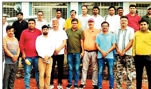
गलत बताने नहीं करेगा. मौके पर सीएसपी भी मौजूद थे. पत्रकारों ने बताया कि कई बार प्रशासनिक सूचनाओं एवं घटनाओं की जानकारी लेने के दौरान सीएसपी का व्यवहार असहज और असम्मान जनक रहा है, जिससे

पत्रकारों ने कड़े शब्दों में कहा है कि यदि अब किसी भी पत्रकार साथियों के साथ दुर्व्यवहार किया गया तो पत्रकार अगला कदम उठाने के लिए विवश हो जाएंगे. इस दौरान एसपी ने आश्चर्य किया कोई भी पुलिस किसी भी मीडिया कर्मी के