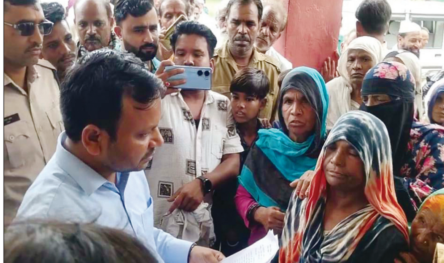
सीहोर. स्मार्ट मीटर के विरोध में श्यामपुर तहसील के आक्रोशित ग्रामीणों ने बिजली कंपनी का घेराव कर प्रदर्शन किया.

प्रदर्शन करने वालों में अनेक महिलाएं भी थी शामिल स्मार्ट मीटर लगाना बंद नहीं किए तो होगा आंदोलन