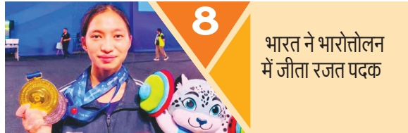
8 भारत ने भारोत्तोलन में जीता रजत पदक