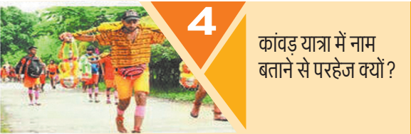
4 कांवड़ यात्रा में नाम बताने से परहेज क्यों?