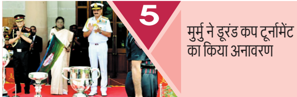
5 मुर्मु ने डूरंड कप टूर्नामेंट का किया अनावरण