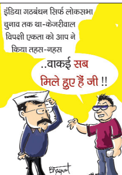
...वाकई सब मिले हुए हैं जी !!