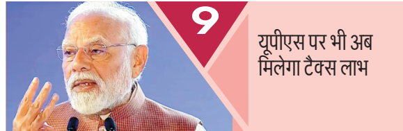
9 यूपीएस पर भी अब मिलेगा टैक्स लाभ