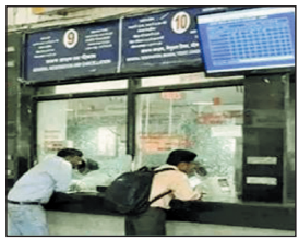
आसानी से हो रही है.

भोपाल. रेलवे यात्री सुविधाओं के लिए एक ही प्लेटफार्म पर रेलवन एप के माध्यम से सुविधा लेकर आ गया है. पहले ही दिन एप में अपडेट आ गया. टिकटों की कालाबाजारी रोकने के लिए 15 जुलाई से आधार नंबर अपडेट करने के बाद ओटीपी आया. उसके बाद ही यात्री टिकट बुक करवा पाएंगे. पहले दिन एप को डाउनलोड करने के बाद पता चला एप ठीक तरीके से काम कर रहा है. टिकटों की बुकिंग भी