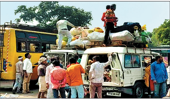
झाबुआ बस स्टैंड से जीपों में सवार होकर गुजरात की ओर जा रहे ग्रामीण...

शासन-प्रशासन के प्रयास धरातल पर साबित हो रहे फिसड्डी