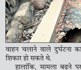
वाहन चलाने वाले दुर्घटना का शिकार हो सकते थे. हालांकि, मामला बढने पर कलेक्टर ने इस मामले पर सजाण लिया और इसका पैच चर्क करवाया. लेकिन अब गौर करने वाली बात यह है कि लगातार

ग्वालियर. मध्य प्रदेश के ग्वालियर में भ्रष्टाचार की पोल वक्त खुल गई जब 18 करोड़ की लागत से बनी सड़क धंस गई. ऐसा पहली या दूसरी बार नहीं बल्कि सातवीं बार हुआ है. हैरान करने वाली बात यह है कि इसे 15 दिन पहले ही बनाया गया था.