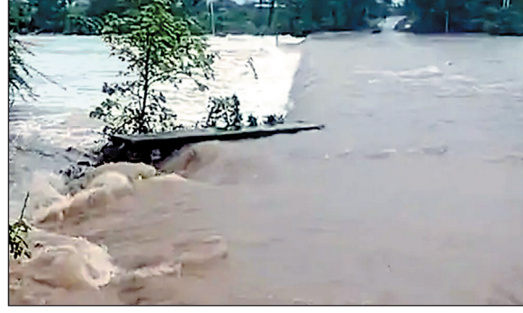
सिंगोली नदी खतरे के निशान से ऊपर बह रही है. शहर की चारों दिशाओं से आने-जाने वाले रास्ते जलभराव के कारण बंद हैं. रतनगढ़ क्षेत्र की गुजाली नदी भी उफान पर है.

नीमच. मंगलवार रात 12 बजे से नीमच जिले के सिंगोली क्षेत्र में भारी बारिश जारी है. बारिश ने पूरे क्षेत्र को प्रभावित किया है. निचली बस्तियों में पानी भर गया है. सिंगोली-नीमच मार्ग पर यातायात पूरी तरह रुक गया है. क्षेत्र की सभी नदियां और नाले उफान पर हैं.