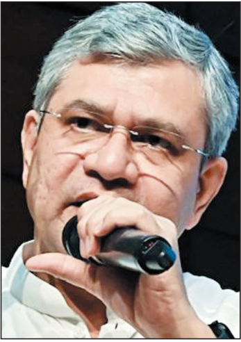
में लिखा। उन्होंने कहा कि भारतीय क्रिएटर सिर्फ एक कथावाचक, यानी कहानियां सुनाने वाले से राष्ट्र-निर्माण करने वाले

गोवा में 20-28 नवंबर तक होगा भारतीय अंतरराष्ट्रीय फिल्म महोत्सव आईएफएफआई 2024 में दिखेंगी 180 फिल्में